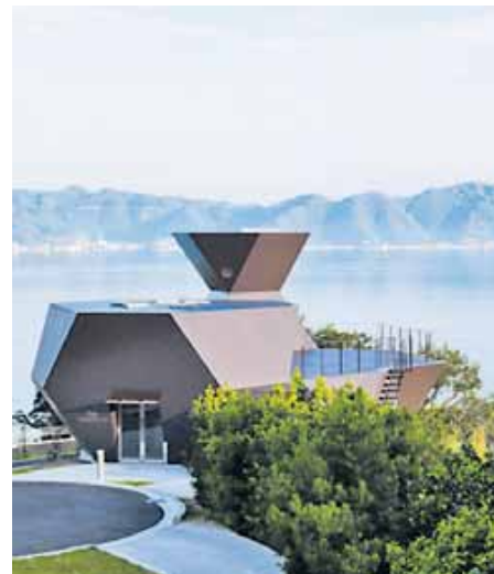
Toyo Ito's Museum der Architektur im japanischen Imabari-shi (2011).

Was Architektur heute sonst noch sein kann und muss, dieser Frage geht Toyo Ito seit dem Beginn seiner Arbeit mit einer Steigkeit nach wie kaum ein anderer in seinem Fach. Dafür und für eine lange Liste außergewöhnlicher Gebäude wird der 71-Jährige nun mit dem Pritzker-Preis ausgezeichnet, dem wichtigsten Preis, den man als Architekt gewinnen kann.